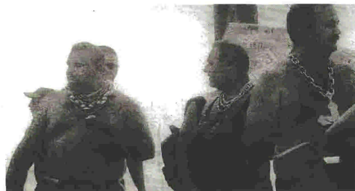
Οι πιστηφάδες που ονειρεύονται τις δόξες της Καμόρα θα φάνε το κεφάλι τους ενώ τα μεγάλα κεφάλια του βουλγαρικού οργανωμένου εγκλήματος δεν φοβούνται τίποτα, καθώς είναι καμουφλαρισμένα πίσω από μάσκες μεγαλοεπιχειρηματιών.