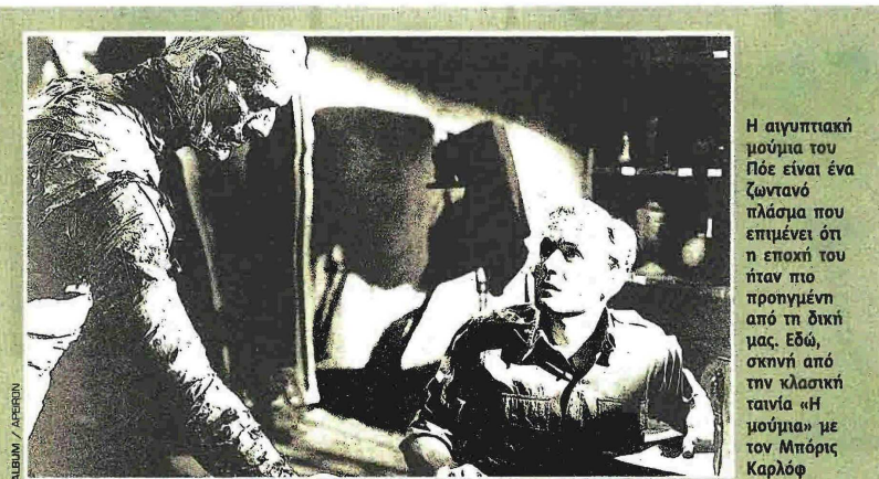
Η αιγυπτιακή μούμια του Πόε είναι ένα ζωντανό πλάσμα που επιμένει ότι η εποχή του ήταν πιο προηγμένη από τη δική μας. Εδώ, σκηνή από την κλασική ταινία «Η μούμια» με τον Μπόρις Καρλόφ

Τι ήταν αυτό που τον έκανε να αρχίσει να αποστρέφεται τον Πλούτο, τον αγαπημένο του γάτο. Ποια δύναμη τον έσπρωξε να μιλήσει το άτυχο ζωντανό, να του βγάλει το ένα του μάτι και να φτάσει να το κρεμάσει στον κήπο του; Και ύστερα, όταν υιοθετεί εκείνον τον