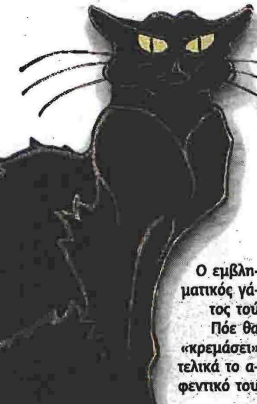
Ο εμβληματικός γάτος του Πόε θα κρεμάσει τελικά το αφεντικό του

Πάντως, την εκδικήσή του θα την πάρει. Όταν, σε μια κρίση παροξυσμού ο άτυχος αφηγητής σκοτώνει την επίσης άτυχη γυναίκα του ανοιγόντάς της με ένα τσεκούρι το κεφάλι και την χτίζει για να εξαφανιστεί το πτώμα της δεν θα πάρει είδηση πως μαζί της, μέσα στον τοίχο θα γλιστρήσει και ο γάτος του. Λίγο αργότερα τα νιαουρίσματά του θα τον προδώσουν στην αστυνομία τη στιγμή που ο ίδιος νομίζει πως όλα έχουν τελειώσει σίσιως γι' αυτόν τον ίδιο. Ο Μαύρος Γάτος είναι ένα από τα εμβληματικά αφηγήματα του Πόε, αυτού του ιδιωματικού συγγραφέα ο οποίος θεωρήθηκε έκτοτε ως πατριάρχης της λογοτεχνίας τρόμου, στην πιο «λαϊκή» του, ας πούμε εκδοχή, συγχρόνως όμως και πρωτόπορος ενός δρόμου που οδήγησε τη λογοτεχνική αφήγηση να δημιου-