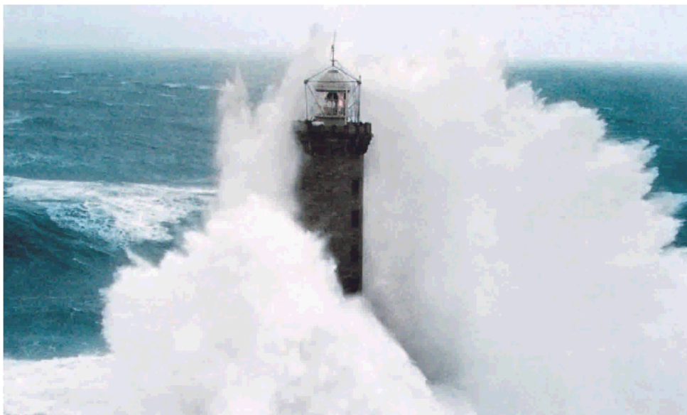
Για τον Τόμας Νταμ, ο σύγχρονος άνθρωπος έχει υπογράψει την αποδοχή μιας κληρονομιάς της μοναξιάς. Η μοναξιά μας νίγηε - ή μήπως αφηρόμαστε πδονικά να βυθιστούμε μέσα της;

Μια ενδιαφέρουσα μελέτη από την Αμερική ανατέμνει τη συνθήκη του σύγχρονου ανθρώπου