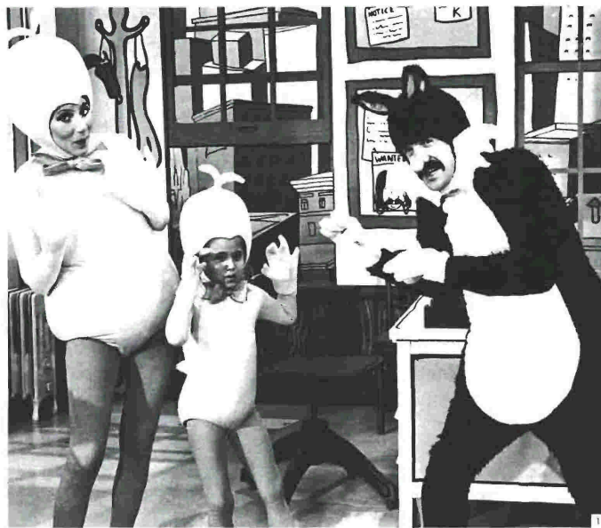
Από τον Μάρκο Καρασαρίνη

Η σύγχρονη ψυχανάλυση προσπαθεί να διερευνήσει γιατί η έννοια της πατρικής φιγούρας και η καταξίωση ή η απαξίωσή της επηρεάζει τον κόσμο περισσότερο από όσο νομίζουμε.