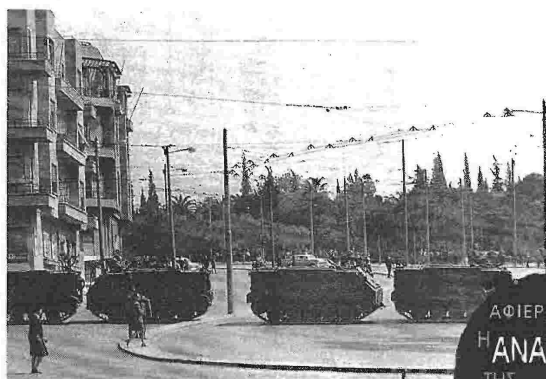
Αθήνα 21 Απριλίου 1967. Οδόφραγμα με τανκς μπροστά στα γραφεία της Ανωτάτης Στρατιωτικής Διοικήσεως Αττικής και Νήσων. Οι πραξικοπηματίες Παπακό, Παπαδόπουλος, Μακαρέζος θέλησαν να εξουδετερώσουν όχι μόνο τους πολιτικούς αλλά και τους πιθανούς στρατιωτικούς πόλους αντίστασης.

Συγκεκριμένα, σημαντικό τμήμα της βιβλιογραφίας καλύπτεται από τις εκδόσεις που κυκλοφόρησαν στο εξωτερικό την περίοδο της δικτατορίας, αναφορικά με τα αίτια του πραξικοπήματος αλλά και τις πολιτικές του καθεστώτος. Με σαφή αντιδικτατορική θέση, οι συγγραφείς των βιβλίων, επικρίναν να αναλύσουν τα όσα συνέβαιναν στη χώρα