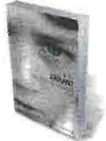
Μ. ΤΖ. ΧΑΪΛΑΝΤ ΤΟ ΣΩΜΑ ΤΟΥ ΨΕΜΑΤΟΣ ΚΑΣΤΑΝΙΩΤΗΣ