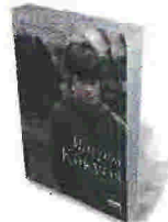
ΝΤΕΪΒΙΝΤ ΜΙΤΣΕΛ ΜΑΥΡΟΣ ΚΥΚΝΟΣ ΕΛΛΗΝΙΚΑ ΓΡΑΜΜΑΤΑ