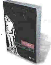
ΝΙΚ ΧΟΡΝΜΠΥ ΠΙΚΡΑ ΠΑΤΑΚΗΣ