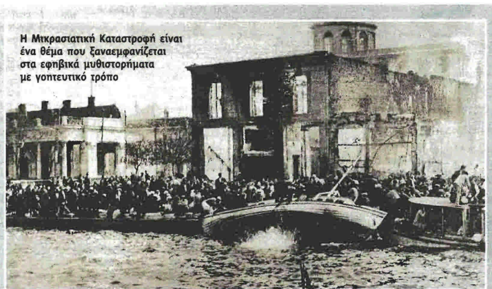
Η Μικρασιατική Καταστροφή είναι ένα θέμα που ξαναεμφανίζεται στα εφηβικά μυθιστορήματα με γοητευτικό τρόπο

Ποιος είναι ο Πέτρος και ποιος ο Παύλος;