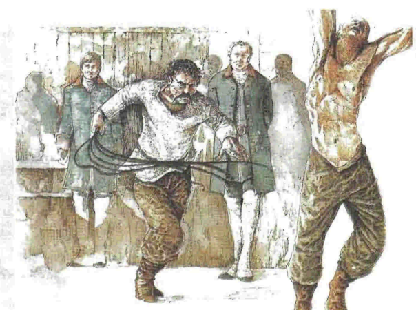
Λογοτεχνία και ιστορία παντρεύονται σε τούτη την υπέροχη έκδοση που εντάσσει το διήγημα του Πούσκιν στην εποχή του - τον ρωσικό 18ο αιώνα δηλαδή

Το όνειρο μιας ζωής έγινε εφιάλτης! Η Σιμ λατρεύει καθετί που έχει σχέση με την Ανταρκτική. Έχει μάλιστα κατασκευάσει κι έναν φανταστικό συνομιλητή, μέλος της ομάδας του εξερευνητή Σκοτ. Όταν ο «θείος Βίκτωρ» την παρασύρει σ' αυτό το ταξίδι, δεν υποπτεύεται ότι γίνεται μαριονέτα στα χέρια του θείου της, ο οποίος θέλει να εξιβεβαιώσει κάποιες παράξενες θεωρίες... Εξαιρετική