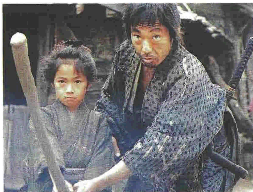
Ένα κορίτσι στην Ιαπωνία εκπαιδεύεται να γίνει σαμουράι. Το μυθιστόρημα της Μάγιας Σνόου ξεχωρίζει για την θεματική του, όπως και η ταινία «Χανά», του Χιροκάζου Κόρε - Έντα