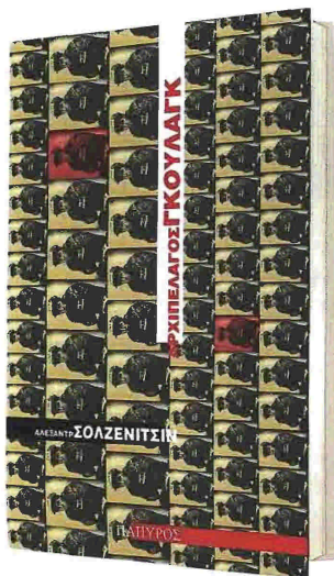
Αρχιπέλαγος Γκουλάγκ Μετάφραση Κίρα Σίνου Εκδόσεις Πάπυρος 704 σελίδες, €23

Γκουλάγκ: μια λέξη που ακόμη και σήμερα προκαλεί αποστροφή και τρόμο. Πρόκειται για τα σκληρά στρατόπεδα καταναγκαστικής εργασίας στα οποία φυλακίστηκαν, υπέφεραν, βασανίστηκαν και πέθαναν περισσότεροι από ασάνια εκατομμύρια άνθρωποι! Ο Αλεξάντρ Σολζενίτσιν γράφει ένα βιβλίο εντυπωσιακό, αναμνηστικό την προσωπική του μαρτυρία -έζησε στα γκουλάγκ περισσότερο από δέκα χρόνια- και τις μαρτυρίες των άλλων κρατούμενων με το ιστορικό πρόσωπο και τις ιστορικές, συχνά άγνωστες, λεπτομέρειες, για να δημιουργήσει μια απέραντη τοιογραφία που αποκαλύπτει τον χαρακτήρα ιστορικού υποκειμένου και αποδεικνύει ότι τα στρατόπεδα δεν ήταν μια απλή παρεκτροπή. Επικράτησαν για 40 χρόνια με αποκορύφωμα την περίοδο των εκκαθαρίσεων του Στάλιν και ήταν συνδεδεμένα με αλόκληρο το σοβιετικό σύστημα εξουσίας. Το «Αρχιπέλαγος Γκουλάγκ» θεωρείται πλέον ένα κλασικό έργο της ρωσικής λογοτεχνίας. Ο ίδιος ο Σολζενίτσιν, ο οποίος τιμήθηκε με το Νόμπελ Λογοτεχνίας το 1970, θεωρούσε ότι ήταν το πιο σημαντικό του έργο.