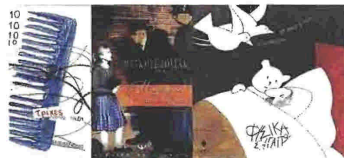
Πώς να καταβροχθίσετε ένα ουράνιο τόξο Γιάννης Τσιμπόπουλος (Sadazhinia), εικονογράφηση Σοφία Τουλιάτου, εκδ. Καστανιώτης

Προτάσεις Ο Γιάννης προσπαθεί να καταβροχθίσει ένα ουράνιο τόξο μαζί με την αδερφή του και τον Τρύφωνα. Πολύχρωμη ιστορία για τη σωστή διατροφή, με πλούσια εικονογράφηση που χορταίνει το βλέμμα.