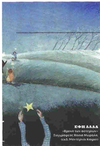
ΕΦΗΛΙΑΔΑ «Βραχί των αστεριών» Συγγραφέας Βασίλη Μωραλή (εκδ. Μοντέρνοι Καιροί)