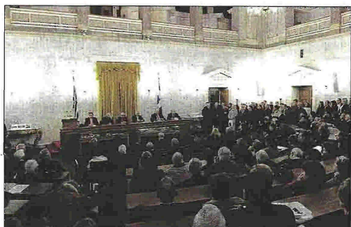
Στο κατάμεστο αμφιθέατρο της Παλιάς Βουλής πραγματοποιήθηκε με μεγάλη επιτυχία η επίσημη παρουσίαση του νέου μυθιστορήματος του βουλευτή.